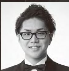
【カスパール王】 総毛 創