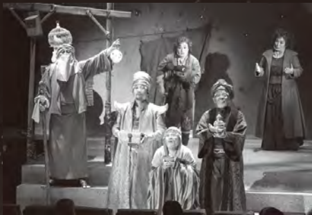
東京文化会館オペラBOX公演より

かつて子どもだった大人たちに、そして、今を生きる子どもたちに贈る、とっておきのクリスマス・オペラ。心ぬくもる時間をお過ごしください。