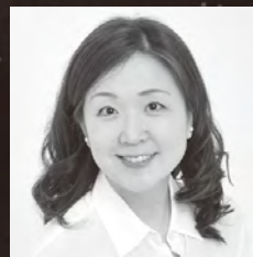
【アマール】 古瀬まきを

脚の不自由な少年アマールは、小さな小屋で母親とふたりで貧しく暮らしていた。ある日、アマールが夜空を眺めていると、まばゆい光を放つ大きな星を見つけた。すると、直後に、その星の行方を追って旅をしているという3人の王様がアマールの家を訪ねてきた。アマールと母親は近所の羊飼いや村人たちとともに王様たちをささやかにもてなしたが、王様たちが寝静まった頃、母親はあまりの貧しさから、王様たちの金に目がくらみ盗んでしまう。見つけた従者は母親を取り押さえたが、王様はそんな母親を必死にかばうアマールに心打たれ、母親を許し、金を与える。しかし、母親はそれを辞退し、アマールは大切な杖を王様たちに差し出した。すると奇跡が起こり…。