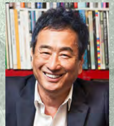
【フルート】 三枝成彰

【管弦楽】 ジャパン・ヴァルトウオーゾ・シンフォニー・オーケストラ 企画構成 / 三枝成彰、大友直人