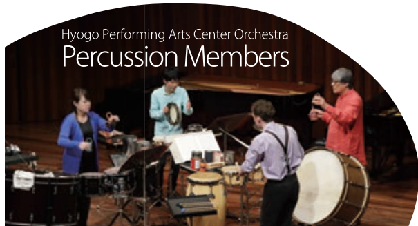
Hyogo Performing Arts Center Orchestra Percussion Members

Ludwig van Beethoven: From Symphony No.9 in D minor, op.125 for Percussion Ensemble