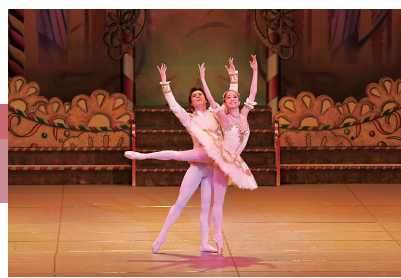
「くるみ割り人形 お菓子の国ヴァージョン」 貞松・浜田バレエ団

「くるみ割り人形」「 Coppélia」等のバレエ衣装や、これまでの公演を振り返るポスター、プログラム、公演映像等を展示します。