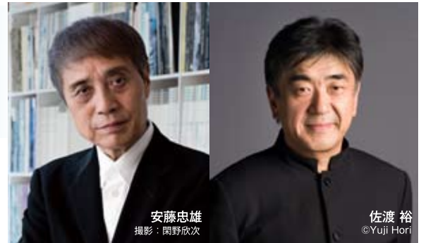
安藤忠雄