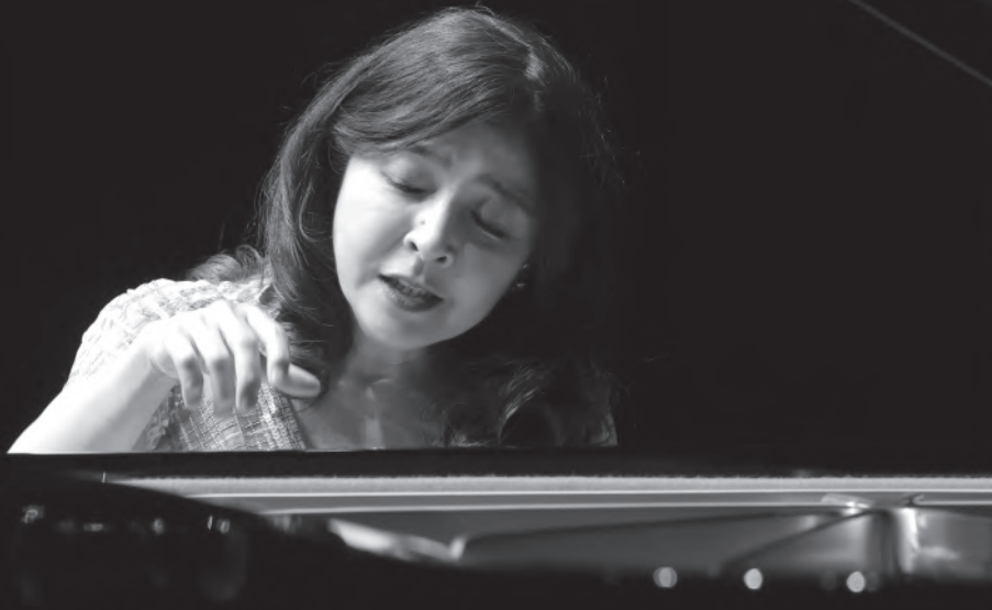
2021年KOBELCO大ホール公演より