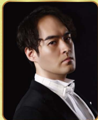
湯浅貴斗 (バス・バリトン)