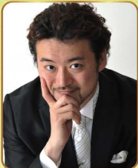
清原邦仁 (テノール/構成・ステージング)