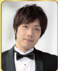
的場正剛 (バリトン)