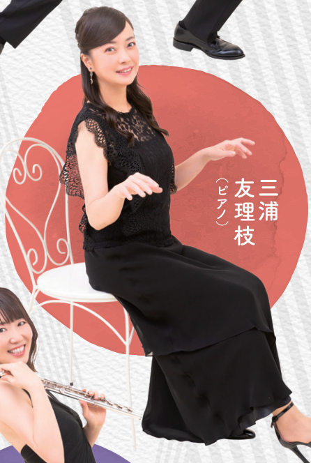
三浦友理枝 (ピアノ)