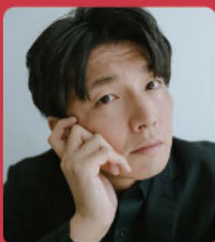
内山建人 (バリトン)