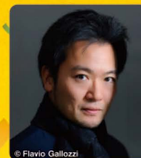
奥村啓吾 (構成・演出)