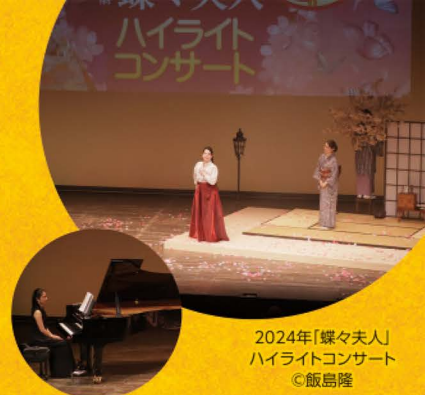
2024年「蝶々夫人」ハイライトコンサート

《あらすじ》舞台はスペイン・セビリア。タバコ工場で働く自由奔放なジプシーの女カルメンは、騒ぎを起こし捕らえられるが、助けてほしいと、伍長ドン・ホセを誘惑する。彼にはミカエラという嫁がいたが、カルメンの魅力に負け、彼女の脱走を助け、自らも軍隊を抜け出し、ジプシーの密輸団の一員となる。しだいに、ホセの束縛に耐えられなくなったカルメンが花形闘牛士エスカミーリョに心を移す中、ホセのもとへミカエラから母親が危篤だとの知らせが届く。母親の元に駆けつけるため密輸団を離れるホセだったが、華々しい闘牛が開催される日に、ホセは再びカルメンの前に現れるのであった。