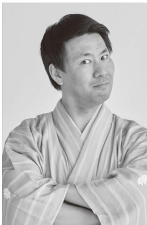
しょうふくてい べべ 笑福亭べ瓶