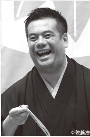
しょうふくてい てつべい 笑福亭鉄瓶

大阪府大阪市出身。京都産業大学在学中の1972年に六代目・笑福亭松鶴に入門。テレビ・ラジオはもちろん、落語会やイベントにも積極的に取り組んでいる。自身の身の回りで起こった日常の話題を面白おかしく話すスタイルは「鶴瓶噺」(つるべばなし)と呼ばれ、独自のジャンルを構築した。2000年上方お笑い大賞受賞。