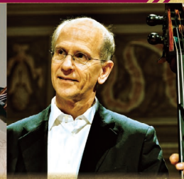
【コントラバス】 ウルリッヒ・ウォルフ

ノルウェー科学技術大学(NTNU) 音楽学科教授・ 元トロンハイム・ソロイスツ芸術監督