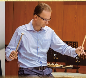
【ティンパニ】 ミハエル・ヴラダー