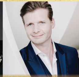
【トランペット】 ヴィム・ファン・ハッセルト